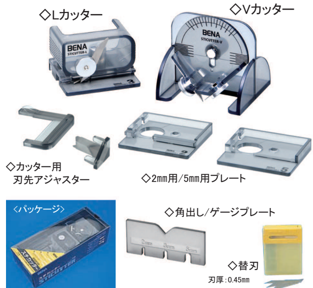
◇カッター用 刃先アジャスター